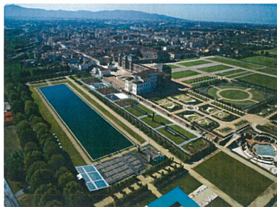
Giardini - Torino