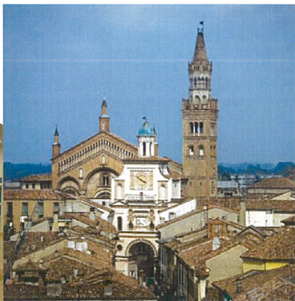
Città di Cremona