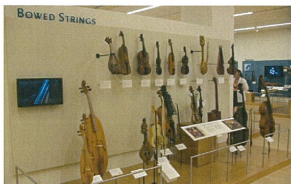
Museo del Violino